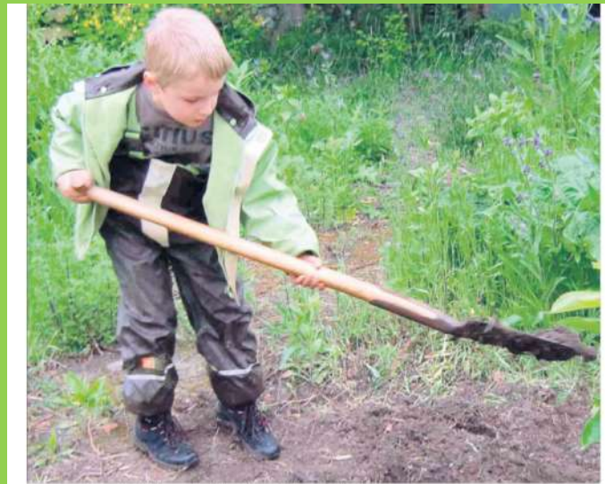
Gärtnern macht Spaß: Das Umweltbildungsprojekt des Bundes Naturschutz kommt bei den Kindern gut an.