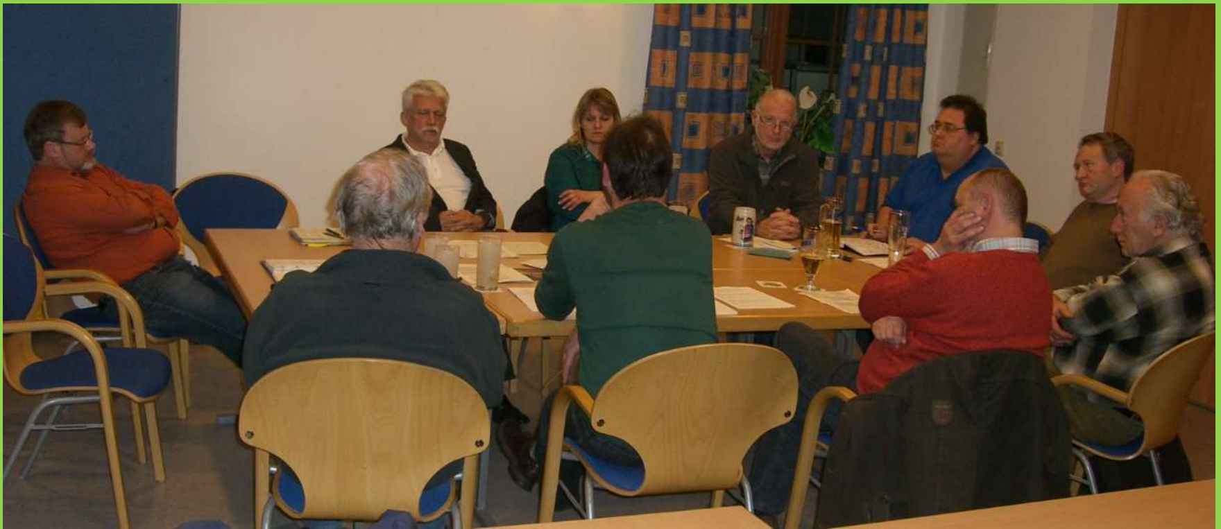
Mehrere Besprechungen des Vorstandes mit den Beisitzern wurden abgehalten