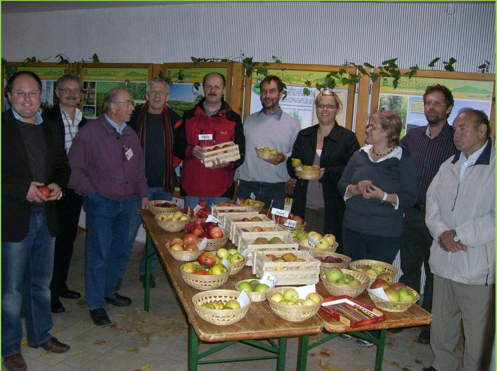
Eröffnung des Apfelfestes und der Obstsortenausstellung