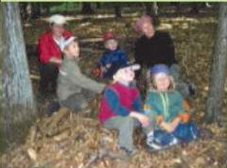
Waldkindergruppe im Wald auf dem Losberg