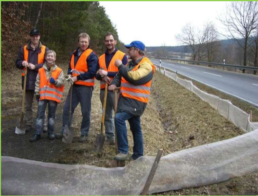
Aufbau des Krötenzaunes bei Gemünd-Jesserndorf