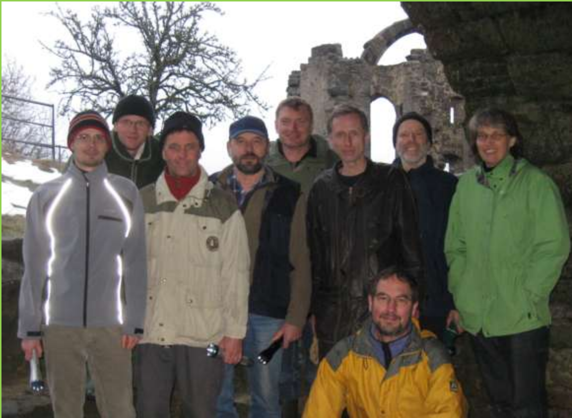
Teilnehmer der Winter-Fledermausexkursion Kontrolle der Winterquartiere in Altenstein