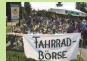
Fahrradbörse bei der Eiswiese