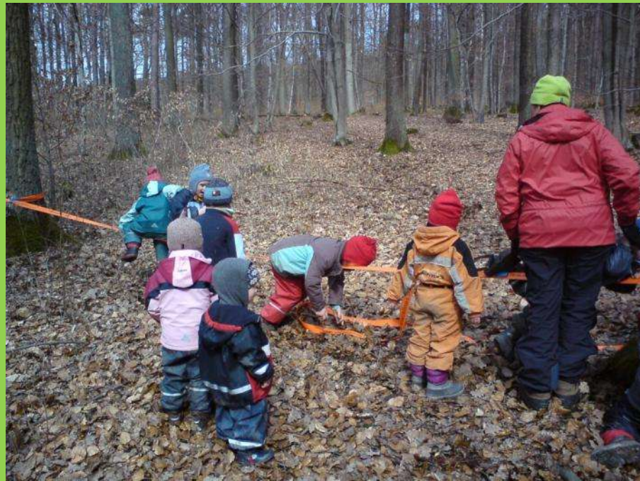
Kinder unserer Waldkinder- gruppe beim „Tanz auf dem Seil“