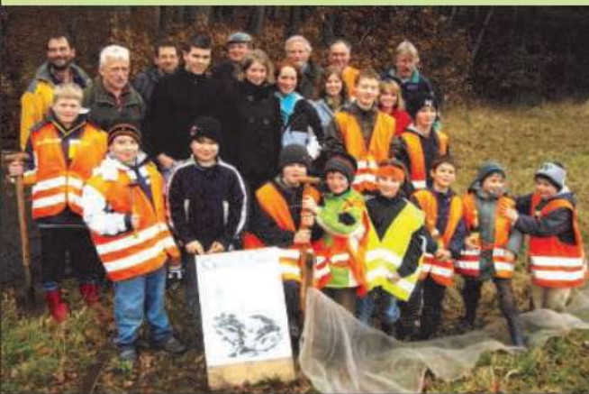
Jung und Alt nach dem Aufbau des Krötenzauns