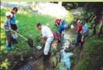
Kinder entdecken das Leben im Angerbach