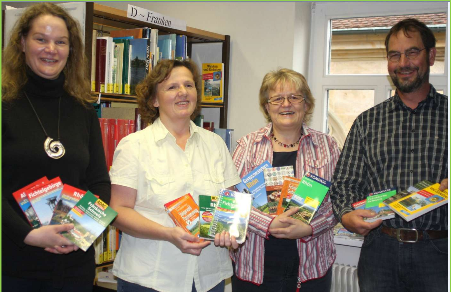
BN Ebern und OGV spenden Wanderbücher aus Franken für die Stadtbücherei Ebern