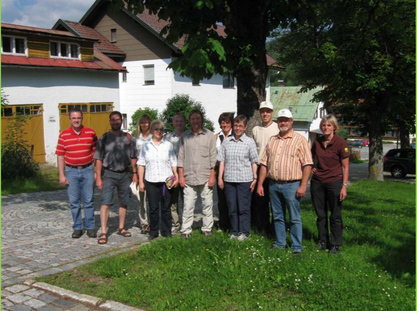
Info-Fahrt des BN Ebern in den Nationalpark Bayerischer Wald