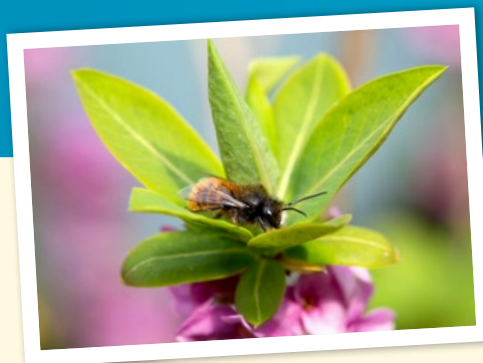
Zweifarbige Schnecken- hausbiene