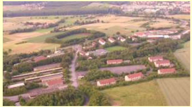
Kaserne im Sommer 2009

Ein solches FSZ brächte auch für die Bürger in